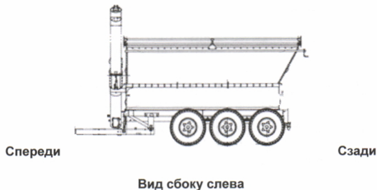
Рис. 2 Основной вид ULW (рис. ULW 40 Tridem)